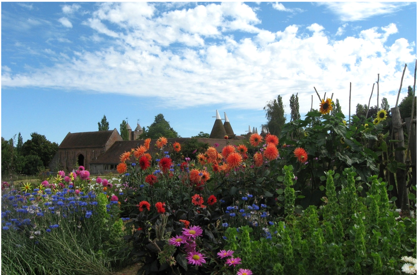
Sissinghurst Castle Garden