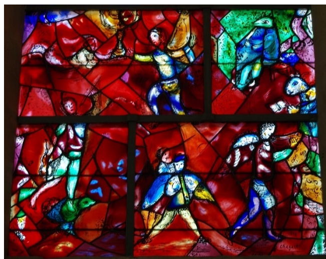
Ausschnitt des Marc Chagall Fenster in Chichester

Nach dem Frühstück führt ein Ausflug in die angrenzende Grafschaft Sussex. Erstes Ziel ist die Kleinstadt Chichester mit ihrer Kathedrale aus dem 11. Jh. Verschiedene Anbauten und Veränderungen gaben der Kirche ihr heutiges Gesicht. Dazu zählt auch der freistehende Campanile, der einzige seiner Art in ganz England . In der Chorapsis bewundern Sie ein weiteres von Marc Chagall gestaltetes Fenster.