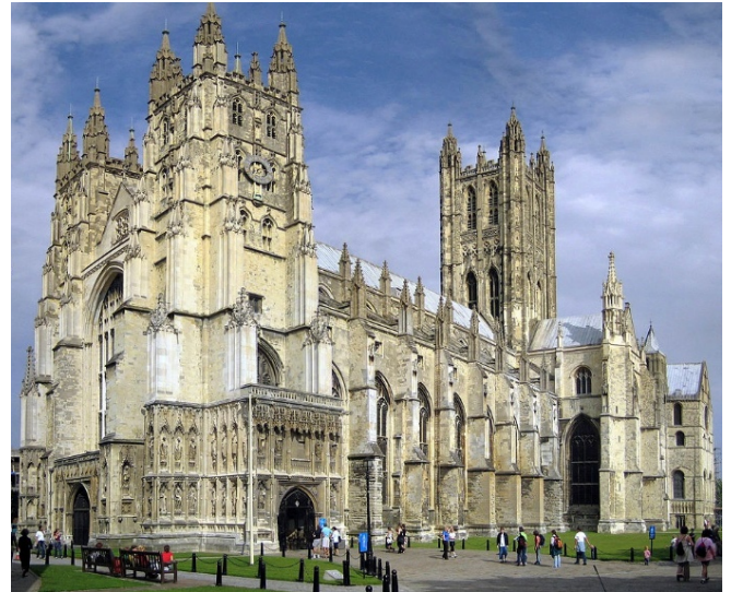
Kathedrale von Canterbury

Den Nachmittag widmen Sie dem Besuch von Canterbury, wo Ihnen eine faszinierende Mischung aus Geschichte, Kultur und Religion begegnet. Eines der wichtigsten Ereignisse der Stadtgeschichte war die Ermordung des Erzbischofs Thomas Becket im Jahr 1170. Nach seiner Heiligsprechung wurde die mittelalterliche Kathedrale mit seinem Grab zu einem Wallfahrtsort für zahlreiche Pilger. Als Teil des UNESCO-Weltkulturerbe gilt das Gotteshaus zudem als meisterhaftes Bauwerk der Romanik und Gotik .