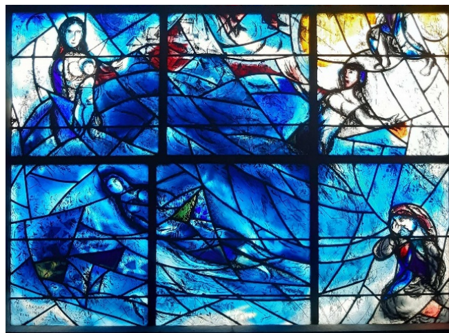
Ausschnitt des Marc Chagall Fenster in Tudeley

Rückfahrt zu Ihrem Hotel und gemeinsames Abendessen.