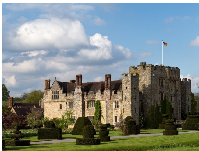
Hever Castle

Am Vormittag erkunden Sie mit Hever Castle einen besonders geschichtsträchtigen Ort. Hier wurde im Jahr 1501 Anne Boleyn geboren, die spätere Ehefrau Heinrich VIII. und Mutter von Königin Elizabeth I. Die herrliche Gartenanlage präsentiert sich auf 50 ha mit prachtvollen Kreationen, künstlichen Seen und einer eindrucksvollen Bepflanzung. Kunstvoll geschnittene Büsche in Form von Schachfiguren sowie der Irrgarten bieten eindrucksvolle Fotomotive.