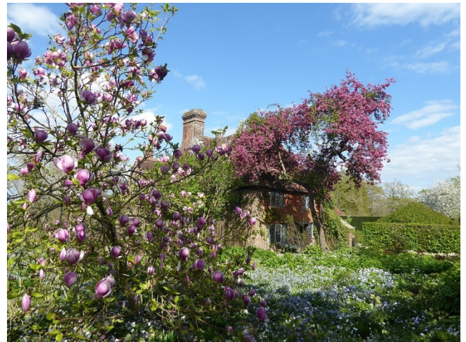
Sissinghurst Castle Garden

Aus einem ursprünglich einfachen Herrenhaus entwickelte sich das heutige Sissinghurst Castle zu einem prächtigen von Wassergräben umgebenen Schloss . Besonders berühmt sind die zauberhaften Gärten, die von der Schriftstellerin Vita Sackville-West seit den 1930er Jahren gestaltet wurden. Das heute vom National Trust verwaltete Anwesen ist eine eindrucksvolle Mischung aus mittelalterlicher Burg, elisabethanischem Herrenhaus und ländlicher Idylle. Getrennt durch Hecken und Mauern entstanden viele Themengärten mit authentischer Atmosphäre , darunter auch der „Weiße Garten“.