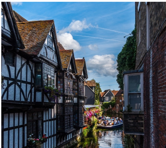
Historische Weberhäuser in Canterbury