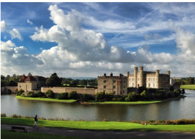
Leeds Castle

Erstes Ziel ist das von einem malerischen See und üppigen Gärten umgebene Wasserschloss Leeds Castle . Das „ Bilderbuchschloss “ diente über mehrere Jahrhunderte als königlicher Rückzugsort und wurde oft und gerne von den Frauen der Herrscher bewohnt. Daher der charmante Beiname „ Schloss der Königinnen “. Die letzte Besitzerin, Lady Baillie, vereinte die mittelalterliche Architektur mit einer eleganten Einrichtung des 20. Jh.s und gab zahlreiche Empfänge für prominente Gäste.